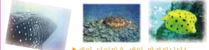
▶ 재미 다이빙은 매일 발견됩니다!